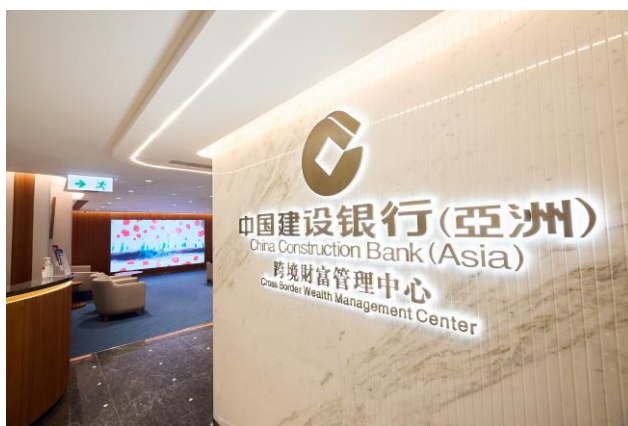
尖沙咀旗艦分行致力打造成高端客戶理財服務中心及跨境財富管理中心。

為打造更舒適的綠色服務空間，尖沙咀旗艦分行採用綠色概念設計，不僅採用環保節能物料及實施綠色營運措施，更特別在跨境財富管理中心內設置一幅約 50 平方呎的環保牆，牆身種植了自生長的藻類植物，能減碳減塵，有助淨化空氣，提升室內環境質素。